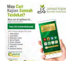
JADWAL KAJIAN SUNNAH INDONESIA