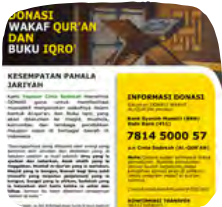
WAKAF QURAN & IQRO