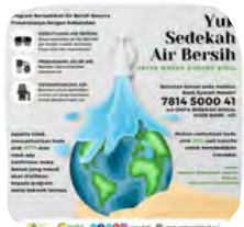
SEDEKAH AIR BERSIH