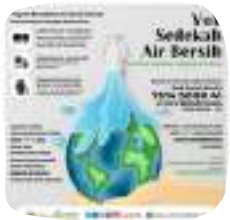
SEDEKAH AIR BERSIH