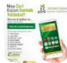
JADWAL KAJIAN SUNNAH INDONESIA