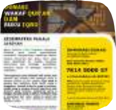
WAKAF QURAN & IQRO