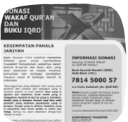
WAKAF QURAN & IQRO