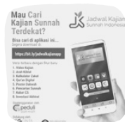
JADWAL KAJIAN SUNNAH INDONESIA