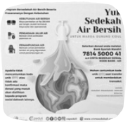
SEDEKAH AIR BERSIH